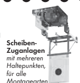
Scheiben- Zuganlagen mit mehreren Haltepunkten, für alle Montagearten

Postfach 1140 · D-35086 Battenberg Tel. (0 64 52) 93 32-0 · Fax: (0 64 52) 93 32-163 E-mail: info@johannsen.de Internet: www.johannsen.de