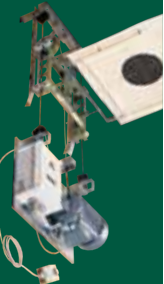
Scheibentransport- anlage 25/50/100 m Als Match und Turnier